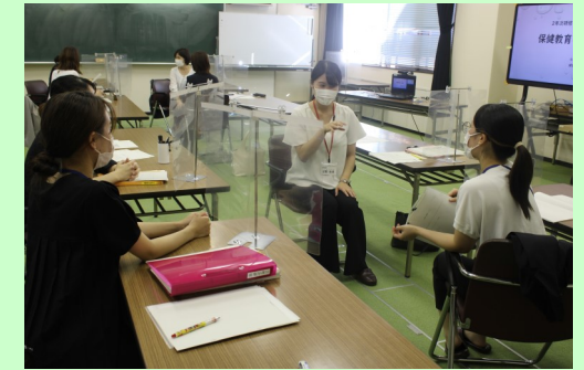
教職経験3年次教員研修