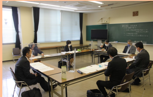
新任園長・校長研修