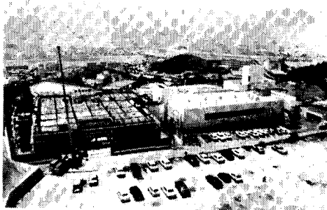
教育センター第二期工事（左側）