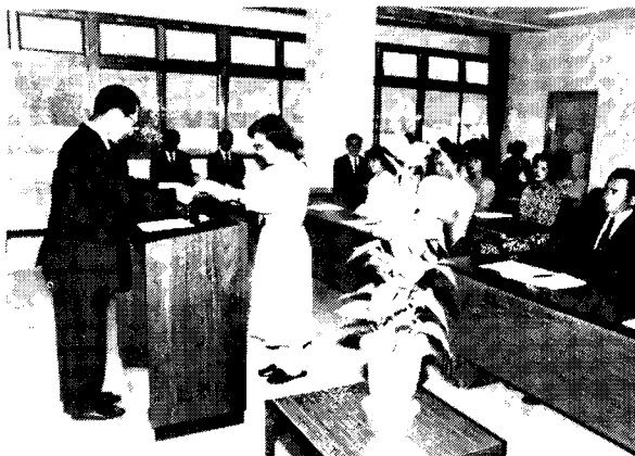
研究協力員の委嘱

なお、研究の成果は研修事業に反映させるとともに、研究紀要等によって教育関係職員に提供し実践の交流が図られるように努める。